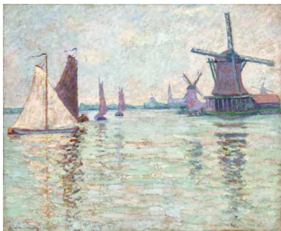
Armand Guillaumin, De Kogmeeuw en De Zaadzaaijer met de Kalverkerk . Olieverf op doek, 60 x 73 cm, 1904. Collectie Musée d'Orsay, Parijs, Frankrijk

Hoewel er dertig jaar tussen zit, is het Zaanse bezoek van Guillaumin ongetwijfeld geïnspireerd geweest op het eerdere verblijf van zijn vriend Monet. De schilderijen met de Zaanse molens laten wel zien dat Guillaumin zijn bezoek nuttig en plezierig vond. Hoewel de Zaanse schilderijen van Monet in de jaren na zijn bezoek steeds beter verkochten, was niet te verwachten dat in die tijd het expressieve en eigenzinnige werk van Guillaumin koopgrage Zaanse kunstliefhebbers zou hebben wakker geschud. En dus gingen ook zijn doeken, net als eerder die van Monet, mee terug naar Frankrijk.