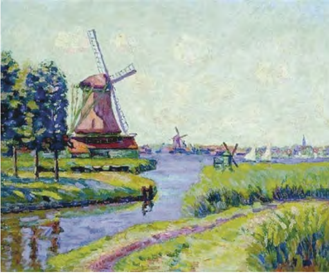
Armand Guillaumin, Les moulins de Saardam. Oliemolen De Oranjeboom gezien vanaf het Kalf. Olieverf op doek, 60 x 72,8 cm, 1904

M eerdere kunstenaars vonden de molens langs de oostoever van de Zaan aantrekkelijk om te schilderen. Guillaumin voegt daar zijn unieke werk aan toe. De kleuren die hij gebruikt neigen door de combinatie van paars met lichtblauw en groen naar het fauvisme. Niet zonder reden werd hij door Franse kunstcritici ook wel omschreven als le plus coloriste des impressionnistes , de meest kleurrijke van de impressionisten. Samen met de losse manier waarop hij de molens neerzet, scheidt hij hiermee een vernieuwende expressionistische harmonie. De kunstschilder blijkt niet geïnteresseerd te zijn in de wind; het ging hem vooral om de levendigheid van het tafereel. De molens lijken immers op verschillende windrichtingen te bewegen. Speelse spiegelingen in het water zijn losjes