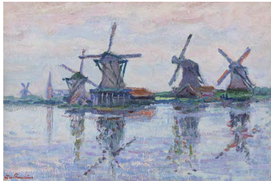
Armand Guillaumin, Schiereiland de Hemmes met v.l.n.r. de oliemolens De Poelsnip, De Zaadzaaijer, De Kogmeeuw, De Zeemeeuw en De Oude Zwan . Olieverf op doek 22 x 33,3 cm., 1904. Collectie Musée Bonnan-Helleu, Bayonne, Frankrijk

In tegenstelling tot Monet koos Guillaumin voor zijn schildersuitstapjes niet Zaandam als verblijfplaats (hoewel hotel De Beurs waar Monet verbleef toen nog steeds vol in bedrijf was), maar streek hij zoals opgemerkt neer in Koog aan de Zaan, één van de Zaandorpen aan de westoever, ongeveer vier kilometer ten noorden van Zaandam.