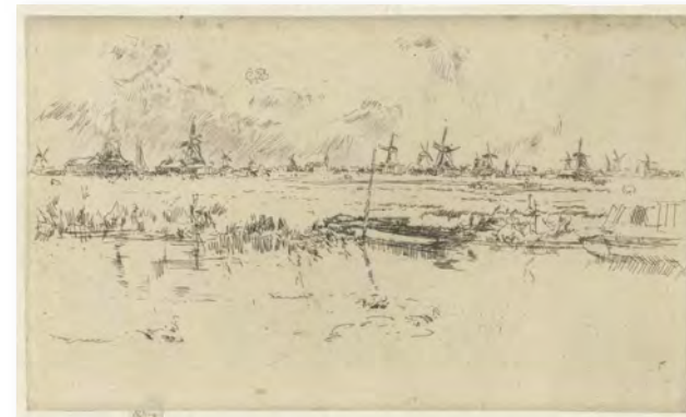
James Whistler, Zicht op het Kalf en de Hemmes Ets, 13 x 21,9 cm.