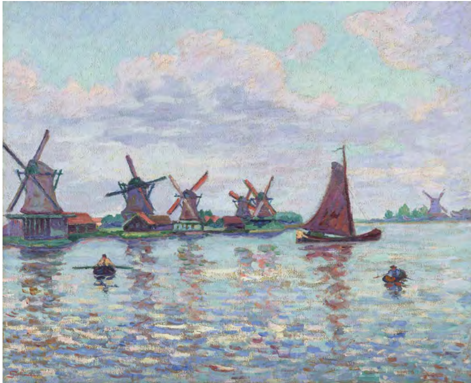
Armand Guillaumin, De Kogmeeuw, De Zeemeeuw, De Oude Zwan, De Roggebloem, De Oranjeboom, De Sint Willebrordus. Olieverf op doek, maten onbekend, 1904

Guillaumin kan worden gezien als een vernieuwer die het grootse en roekeloze gebaar niet schuwde. Uit zijn schilderijen blijkt op geen enkele manier dat hij in het geveel bij het publiek wilde komen door te voldoen aan bepaalde verwachtingen. Zijn aanpak werd vooral gewaardeerd in kunstenaarskringen, zoals door Cézanne, Pissarro en ook Van Gogh die hem regelmatig bezocht in zijn atelier aan de Quai d'Anjou 13 in Parijs, het vroegere atelier van Charles-François Daubigny, de kunstenaar die in 1870 samen met Monet naar Londen vluchtte. Guillaumin betrok het atelier in 1875.