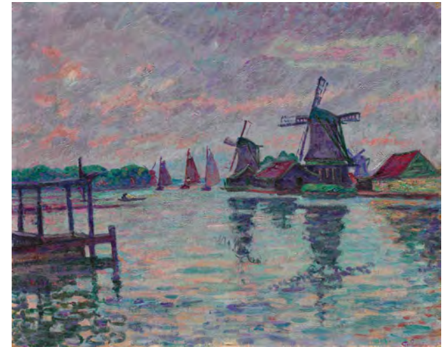
Armand Guillaumin, Oliemolens De Windhond of Dunbil en De Ooievaar. Olieverf op doek, 65 x 80 cm, 1904. Collectie Musée d'Orsay, Parijs, Frankrijk

In zijn Zaanse werk is Guillaumin geen impressionist maar een expressionist; hij drukt zijn eigen stempel op dat wat hij ziet. Hij breekt daarmee met de oude regels van het realisme en brengt daarmee spanning in zijn werk. Het daagt uit om op een andere manier naar de wereld te kijken. De Zaanstreek stond met een schaalvergroting in de industrie, van windkracht naar machinale aandrijving, op de drempel van een nieuwe wereld, een ontwikkeling die een nieuwe dynamiek met zich meebracht. Guillaumin gaf die nieuwe dynamiek op een eigentijdse en energieke manier weer. Deze brutale visie kon ook maar moeilijk worden geaccepteerd door zijn tijdgenoten. Afgezien van een handvol kunstenaars die net als hij op zoek was naar een manier om een nieuw levensgevoel aan schilderen mee te geven, waren de meesten van hen niet gediend van die vreemde kleuren en de verwrongen vormen. Dat nieuwe levens-