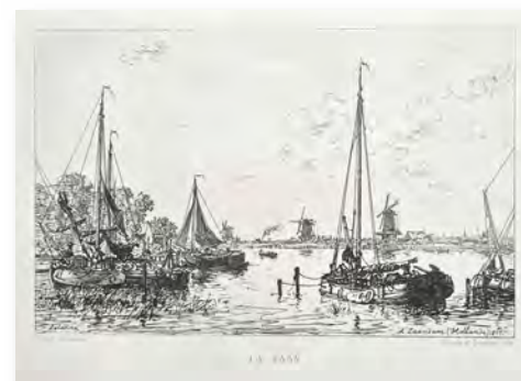
Maxime Lalanne, La Zaan a Zaandam Heliogravure, 19,6 x 28 cm., 1877 Bron: La Hollande a vol d'oiseau