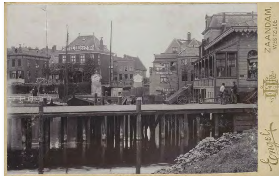
Hotel De Beurs (rechts). Foto, circa 1900

Dit keer gaat het niet om Claude Monet die in juni 1871 met zijn gezin in Zaandam voet aan wal zette. De raderstoomboot Prins van Oranje bracht hen in een half uurtje varen over het IJ naar de aanlegplaats aan de Hogendijk. Er werd een kamer betrokken in hotel De Beurs, op loopafstand vlak naast de sluis gelegen. De molens, de bont gekleurde huizen en schepen, de hoge wolkenluchten en het schitterende licht van de Zaan inspireerden hem. Tijdens de vier maanden van zijn Zaanse verblijf maakte de Fransman maar liefst vijftig schilderijen.