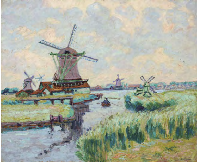
Armand Guillaumin, Oliemolens De Oranjeboom gezien vanaf het Kalf. Olieverf op doek, maten onbekend, 1904

De Franse kunstschilder, toen de zestig jaar al gepasseerd, bezocht de Zaanstreek in mei en juni 1904, drieëndertig jaar na het bezoek van Monet. Het was ook Monet die hem aanraade eens naar de Zaanstreek te reizen. Guillaumin is uiteindelijk minder bekend geworden dan Monet, maar dat maakt hem als kunstschilder zeker niet minder interessant. Net als Monet zag Guillaumin het exotische karakter van de streek met haar water, hoge wolkenluchten, bijzonder gekleurde houten panden en vooral de molens. Daarnaast was Guillaumin één van de vooruitstrevende kunstenaars die in de eerste jaren van de twintigste eeuw het impressionisme verder ontwikkelde tot het expressionisme.