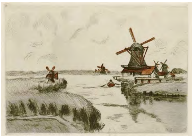
Armand Guillaumin, Oliemolen De Oranjeboom aan het Kalf in Zaandam. Ingekleurde ets naar een olieverfschilderij, maten onbekend Gepubliceerd in: Histoire des peintres impressionnistes , 1906

De Franse schrijver Théodore Duret (1838 – 1927) beschreef de levensgeschiedenis van Guillaumin in zijn Histoire des peintres impressionnistes . Het boek verscheen in 1906. Eén van de afbeeldingen hierin is een ets die Guillaumin maakte van oliemolen De Oranjeboom. De ets signeerde hij rechtsonder met zijn initialen.