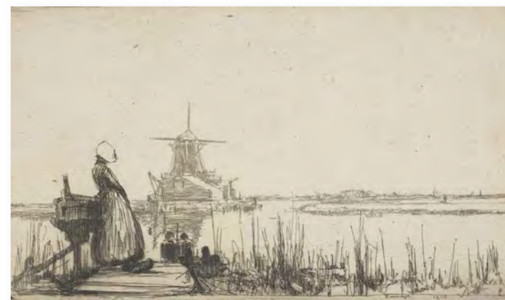
James McBey, Oliemolen De Zoeker Ets, 10,2 x 17,6 cm., 1910 Collectie National Galleries of Scotland, Edinburgh, Schotland

In navolging van Monet bezochten meerdere buitenlandse kunstenaars de Zaanstreek om er te schilderen. Eén van hen was bijvoorbeeld de Amerikaan James Whistler (1834 – 1903). Anderen waren onder meer Francis Seymour Haden (1818 – 1910), David Young Cameron (1865 – 1945), James McBey (1883 – 1959) en Maxime Lalanne (1827 – 1886). En zo was er ook Armand Guillaumin, vriend en collega van Monet.