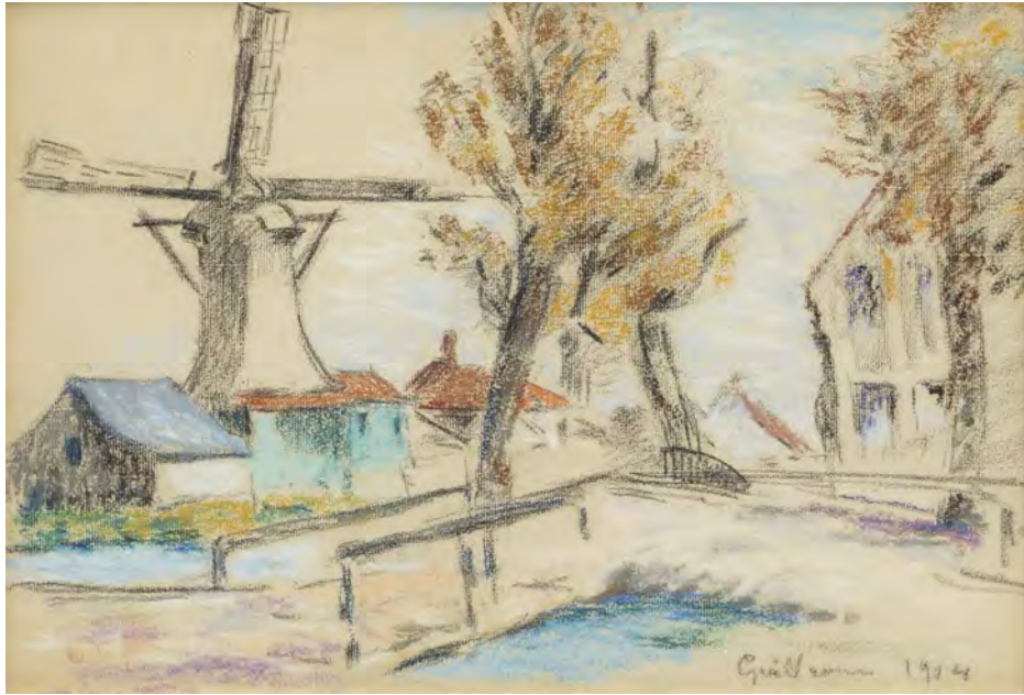
Armand Guillaumin, Het Windei, oliemolen aan de oostoever in Zaandam. Pastel, 29 x 41,5 cm, 1904