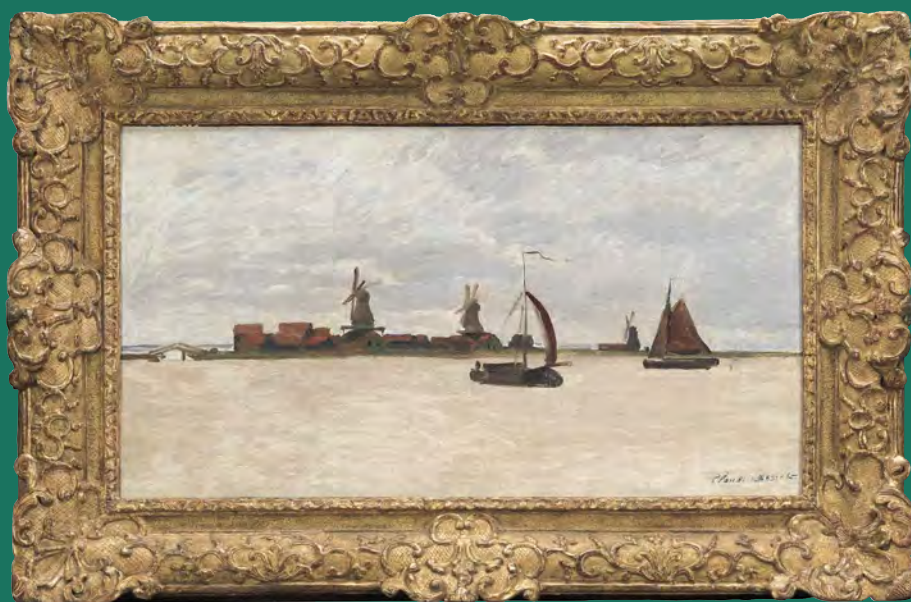
Claude Monet, De Voorzaan en de Westerhem Olieverf op doek, 39,2 x 71,5 cm., 1871 Collectie Zaan Museum

Monet had als kunstschilder al enige naam gemaakt maar zou pas later zijn grote bekendheid krijgen. In de tijd dat hij ook Zaandam bezocht waren zijn kleurrijke schilderijen nauwelijks aan de man te brengen. Vooralsnog moest het kunstminnende publiek wennen aan zijn vernieuwende manier van schilderen. Ook de Zaan kanter zal meewarig en met verbazing hebben gekeken naar het werk wat Monet daar op het doek schilderde. Een portret, dat van Guurtje, bleef bij de familie Van de Stadt achter in Zaandam. De andere vierentwintig gingen in de bagage mee, terug naar Parijs. Eén van de drie genoemde Westerhem schilderijen keerde in 2015 terug naar de Zaanstreek en is nu het topstuk van het Zaan Museum.