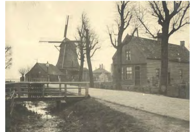
Oliemolen Het Windei.