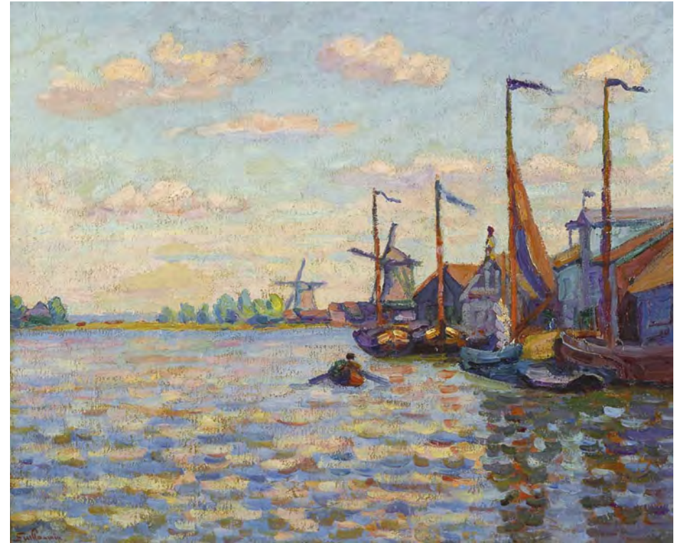
Armand Guillaumin, De Koger Hem met pakhuis New York en de molens De Hondeman en Sint Willebrordus aan de andere zijde van de Zaan, Olieverf op doek, maten onbekend, 1904

M eerdere kunstenaars vonden de molens langs de oostoever van de Zaan aantrekkelijk om te schilderen. Guillaumin voegt daar zijn unieke werk aan toe. De kleuren die hij gebruikt neigen door de combinatie van paars met lichtblauw en groen naar het fauvisme. Niet zonder reden werd hij door Franse kunstcritici ook wel omschreven als le plus coloriste des impressionnistes , de meest kleurrijke van de impressionisten. Samen met de losse manier waarop hij de molens neerzet, scheidt hij hiermee een vernieuwende expressionistische harmonie. De kunstschilder blijkt niet geïnteresseerd te zijn in de wind; het ging hem vooral om de levendigheid van het tafereel. De molens lijken immers op verschillende windrichtingen te bewegen. Speelse spiegelingen in het water zijn losjes