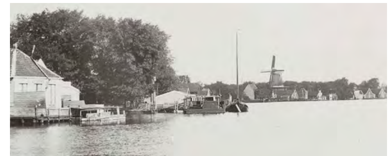
Herberg De Waakzaamheid met zicht op de korenmolens De Bleeke Dood in Zanddijk

In de tijd dat Guillaumin er neerstreek had de uitspanning, bij de Kogersluis direct aan de Zaan gelegen, aan de achterzijde een aanlegsteiger wat een weids uitzicht bood over de Zaan en de molens aan de oostoever. Vanaf deze steiger lopen zichtlijnen van meerdere schilderijen die Guillaumin maakte van de molens op het schiereiland de Hemmes aan de overzijde van de Zaan. Ook stak hij met een roeibootje het Zaanse water over. Voor zover bekend maakte hij zeventien schilderijen van de molens die daar aan de oostoever van de Zaan stonden, van buurtschap het Kalf in het zuiden tot aan de Kalverringdijk in het noorden.