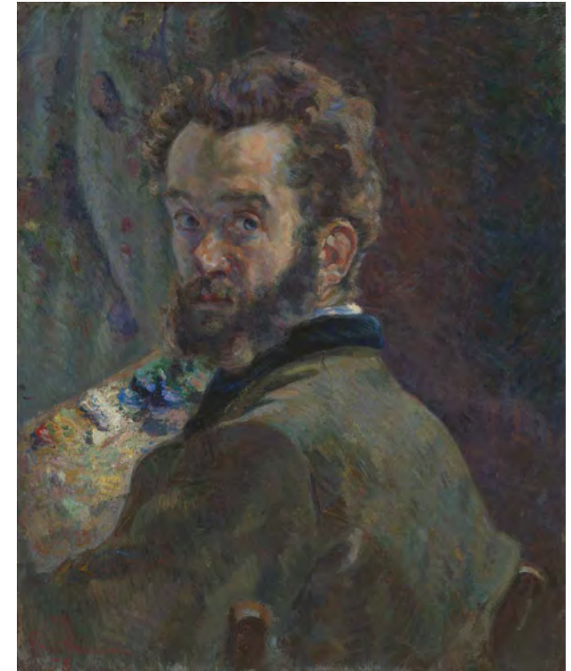
Armand Guillaumin, Zelfportret met palet. Olieverf op doek, 60 x 50 cm, 1878. Collectie Van Gogh Museum, Amsterdam (Vincent van Gogh Stichting)

Van Gogh haalde in een brief aan zijn broer Theo herinneringen op aan een bezoek aan het atelier van Guillaumin: