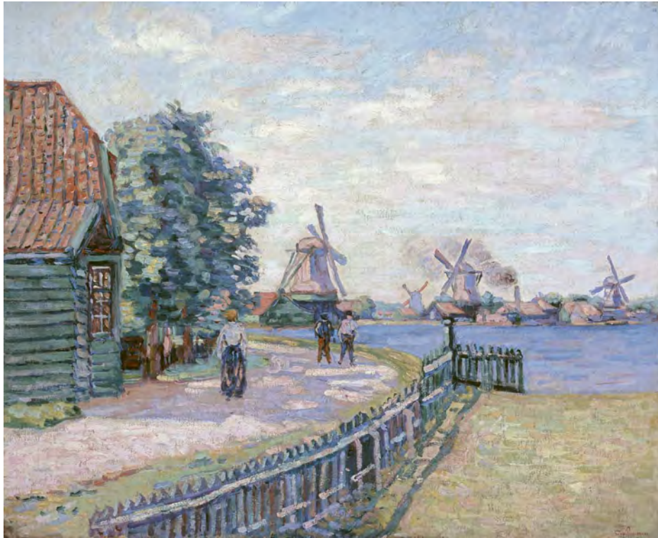
Armand Guillaumin, Molens aan de Zaan. De pelmolens De Sint Willebrordus, Hondeman of Sint Pieter (in de achtergrond), Zeeman en Windei. Olieverf op doek, 61 x 73 cm, 1904

In zijn Zaanse werk is Guillaumin geen impressionist maar een expressionist; hij drukt zijn eigen stempel op dat wat hij ziet. Hij breekt daarmee met de oude regels van het realisme en brengt daarmee spanning in zijn werk. Het daagt uit om op een andere manier naar de wereld te kijken. De Zaanstreek stond met een schaalvergroting in de industrie, van windkracht naar machinale aandrijving, op de drempel van een nieuwe wereld, een ontwikkeling die een nieuwe dynamiek met zich meebracht. Guillaumin gaf die nieuwe dynamiek op een eigentijdse en energieke manier weer. Deze brutale visie kon ook maar moeilijk worden geaccepteerd door zijn tijdgenoten. Afgezien van een handvol kunstenaars die net als hij op zoek was naar een manier om een nieuw levensgevoel aan schilderen mee te geven, waren de meesten van hen niet gediend van die vreemde kleuren en de verwrongen vormen. Dat nieuwe levens-